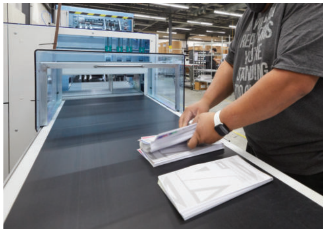
Einfaches sammeln der vorgeleimten Signaturbuchblöcke für die nachfolgende Klebebindung.