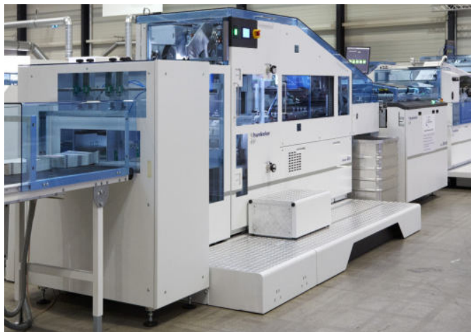
Die Hunkeler Buchproduktionsanlage «Roll-to-Plowfold-Lösung» bei BR Printers produziert bindefertige, geleimte Buchblöcke und ermöglicht dem HP Drucker T240 PageWide Web Press, mit seiner maximalen Nenngeschwindigkeit zu produzieren.