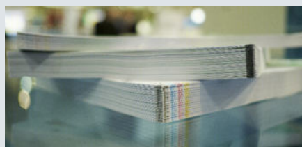
Die Hunkeler Buchblock-Anlage produziert absolut flache Buchblöcke, welche sich einfach weiterverarbeiten lassen.

Boston besucht und war 2019 auch an den Hunkeler Innovationdays in Luzern, Schweiz. Die Leute in beiden Organisationen sind grossartig. Sie liefern ein gutes Produkt und sie stehen dazu. Das ist in einem schnelllebigen Geschäft wie unserem absolut entscheidend!"